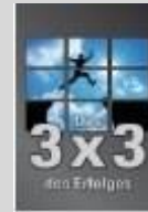
Torsten Boorberg Das 3 x 3 des Erfolges